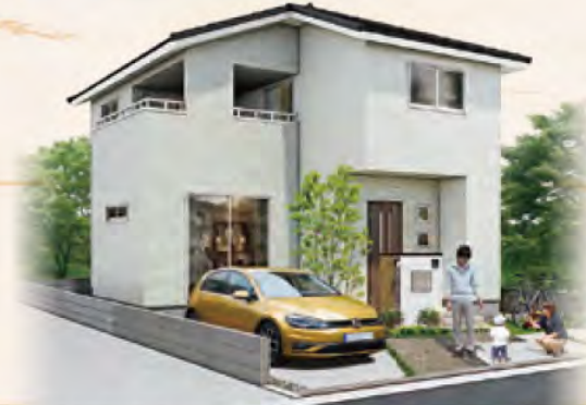
※オークラホーム瀬戸町瀬戸Ⅲ 3号地分譲住宅完成イメージパースです。