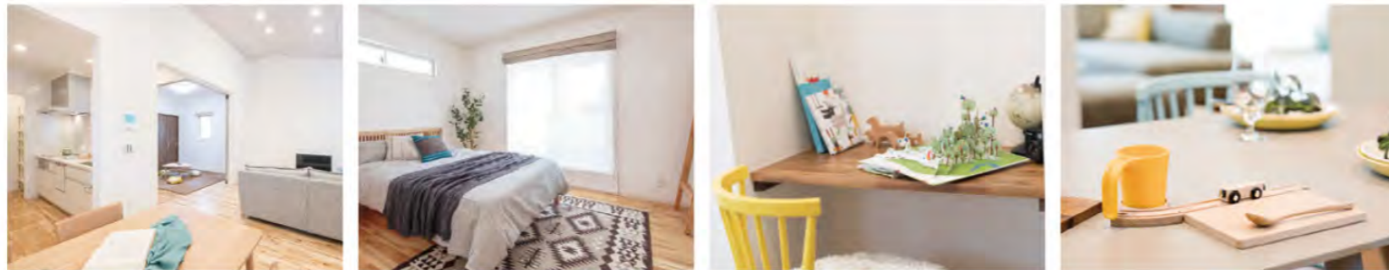
※内観はイメージ写真です。