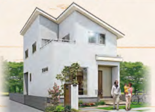
※オークラホーム瀬戸町瀬戸Ⅳ 4号地分譲住宅完成イメージパースです。

[オークラホーム瀬戸町瀬戸Ⅱ 分譲住宅概要] ●所在地 / 岡山市東区瀬戸町瀬戸古川314番7他 ●交通 / JR山陽本線「瀬戸」駅徒歩8分(約640m) ●総戸数 / 7戸(内オークラホーム瀬戸町瀬戸Ⅱ・3戸) ●今回報売戸数 / 2戸 ●敷地面積 / 151.96㎡(3号地)、164.48㎡(4号地) ●延床面積 / 113.44㎡(3号地)、105.16㎡(4号地) ●販売価格 / 34,672,000円(税込)(3号地)、33,958,000円(税込)(4号地) ●構造 / 木造枠組壁工法 ●建築確認番号 / H29岡セ確建第001035号(3号地)、H29岡セ確建第001173号(4号地) ●建物完成年月 / H30年4月 ●入居予定 / 即入居可 ●用途地域 / 第2種住居地域 ●地目 / 宅地 ●建ぺい率 / 60% ●容積率 / 200% ●道路 / 5m ●私道負担 / なし ●電気 / 中国電力 ●水道 / 公営水道 ●ガス / LPG(オール電化) ●雑排水 / 公共下水 ●取引態様 / 売主:株式会社 大倉 ※広告有効期限 / H30年7月末日 ※先着順受付につき、売約済みの場合がございます。予めご了承ください。※掲載の外構図の植栽は、予定種の成長後のイメージで、本々の成長の度合いにより形状は異なります。※プラン上の家具・車はレイアウトの参考例です。※距離表示については地図上の概測距離を算出したものです。