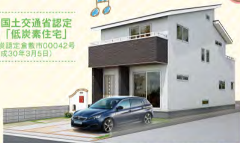
※2号地コンセプトハウス完成イメージバースです。

省エネ住宅 国土交通省認定「低炭素住宅」 第H29低炭素認定倉敷市00042号 (平成30年3月5日)