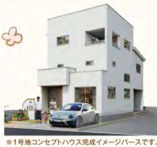
※1号地コンセプトハウス完成イメージバースです。